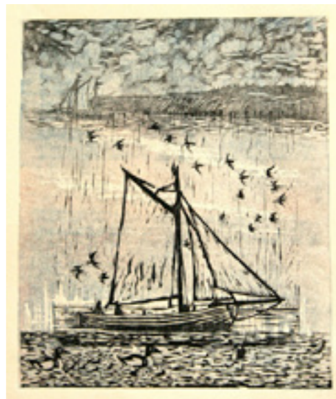
Rylen og gravvænder unika træsnit 35cm x 30cm

Værkerne udføres primært af medlemmer af Danske Grafikere, der rummer 250 professionelt udøvende kunstnere/grafikere. Trykkene du modtager er eksklusivt lavet til GRAFIK:VEN og i et begrænset oplag.